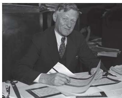
Arthur Wynne (* 1862 in Liverpool, † 1945)

Erfunden hat es der Journalist Arthur Wynne , nachdem ihn sein Chef beauftragt hatte, sich einen netten Zeitvertreib für die Weihnachtsbeilage auszudenken. Zwei Tage brütete Wynne vor sich hin und kreierte schliesslich aus 31 Suchbegriffen ein rautenförmiges Wortspiel, das er Word-Cross Puzzle nannte. Das Kreuzworträtsel von Wynne enthielt noch keine schwarzen Felder und war rautenförmig angeordnet.